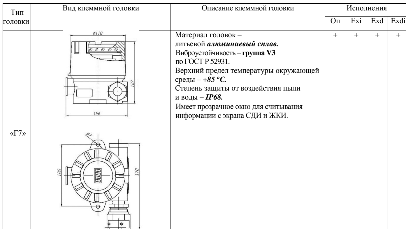
Таблица 3 – Типы клеммных головок и их внешний вид (с базовыми вариантами кабельных вводов)

Примечание к таблице 2 – ТСПУ 031П/ИНД с защитным корпусом типа «K1» могут устанавливаться в грунт. В этом случае у ТСПУ 031П/ИНД основание корпуса отсутствует и в примере записи при заказе в позиции «Диаметр поверхности, на которую устанавливается ТСПУ 031П/ИНД» вместо значения диаметра D указывается «грунт».